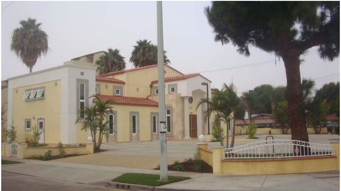
Cổng vào bên tay trái