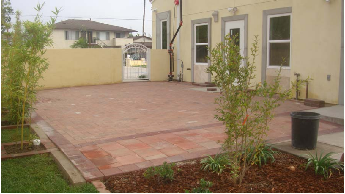
Bên hông phải Trụ Sở