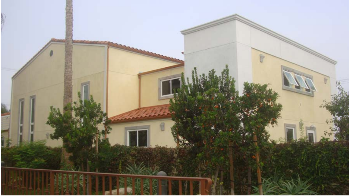
Mặt sau của Trụ Sở