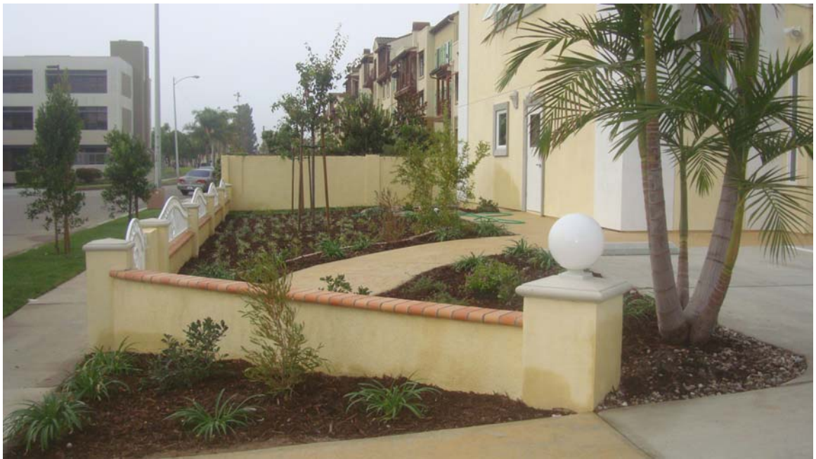
Bên hông trái Trụ Sở