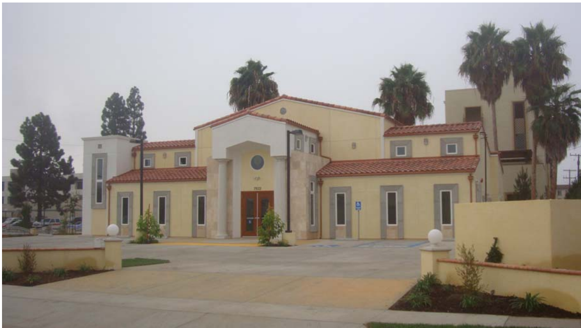
Cổng vào bên tay phải

Dưới đây một số hình mới của Trụ Sở Xây Dựng Vô Vi