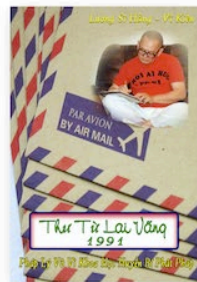
Thư Từ Lai Vãng Năm 1991