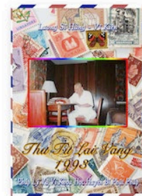
Thư Từ Lai Vãng Năm 1993