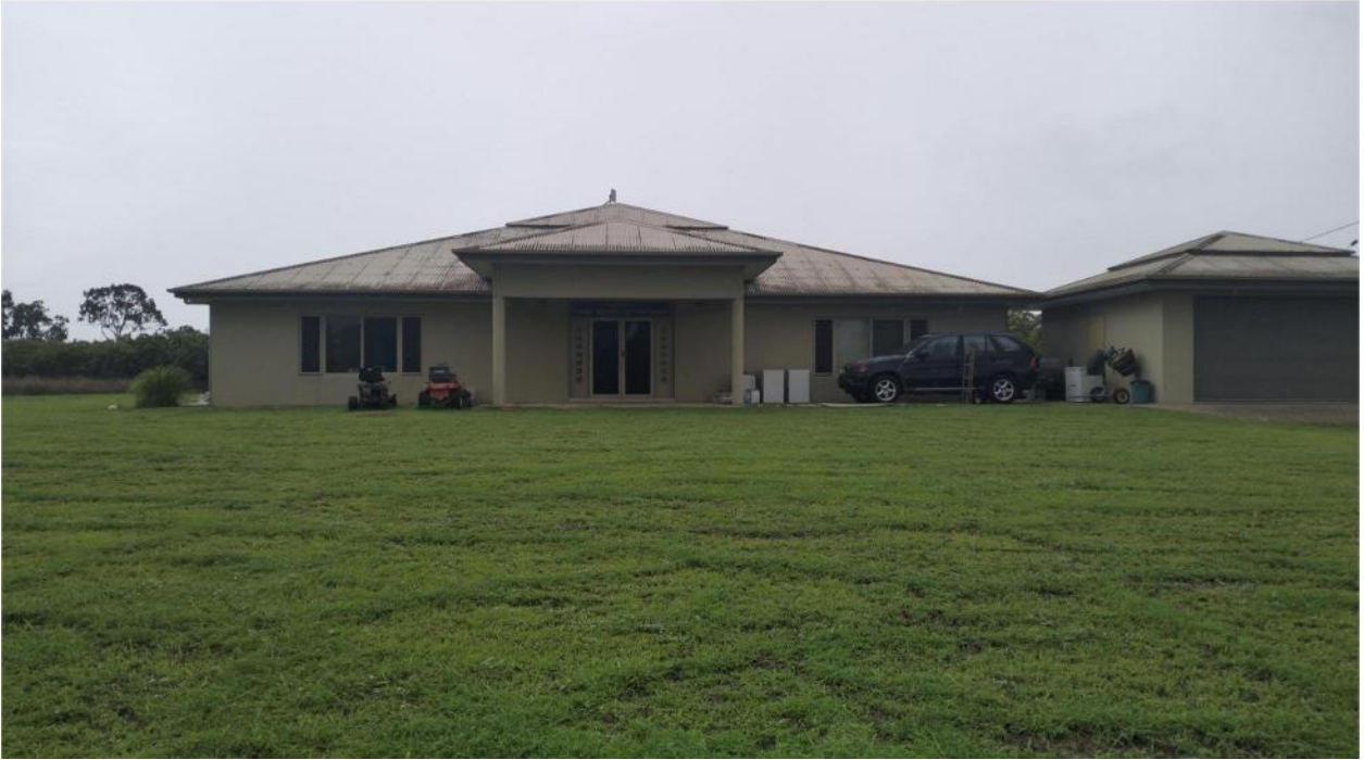
Ngôi nhà Tình Thương của Đức Thầy Vĩ Kiên