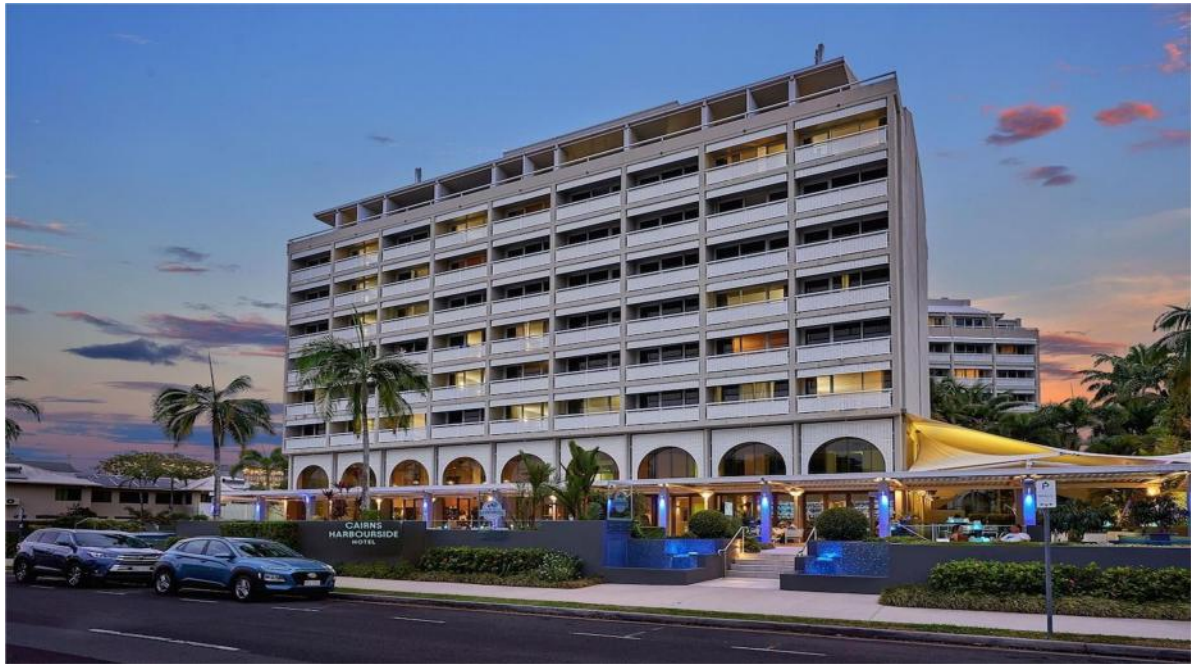
Khách Sạn Cairns Harbourside Hotel tại City Cairns