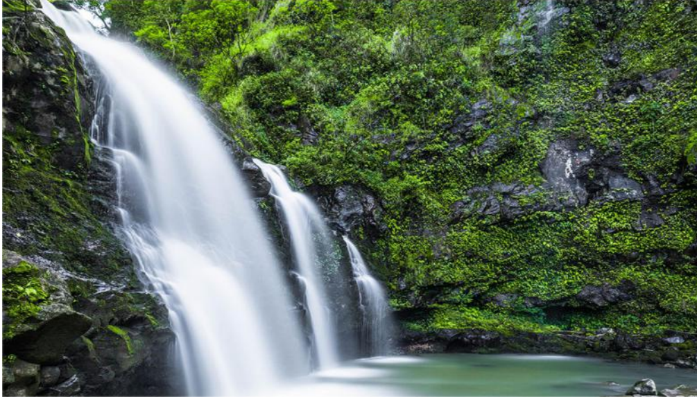
Thác nước Pua'a Kaa trên con đường Hana (đảo Maui)