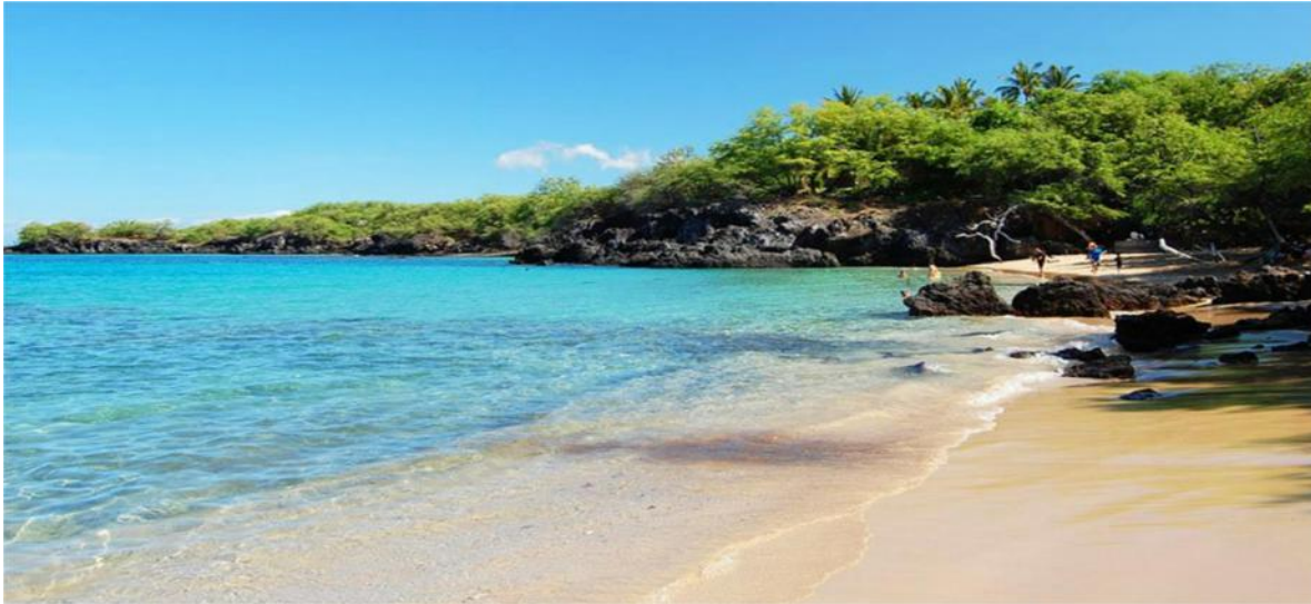
Bãi biển Waialea nằm khuất sâu trong những tảng đá, nước biển trong veo và bãi cát trắng rất mịn màng ( vùng Kona, đảo Big Island)