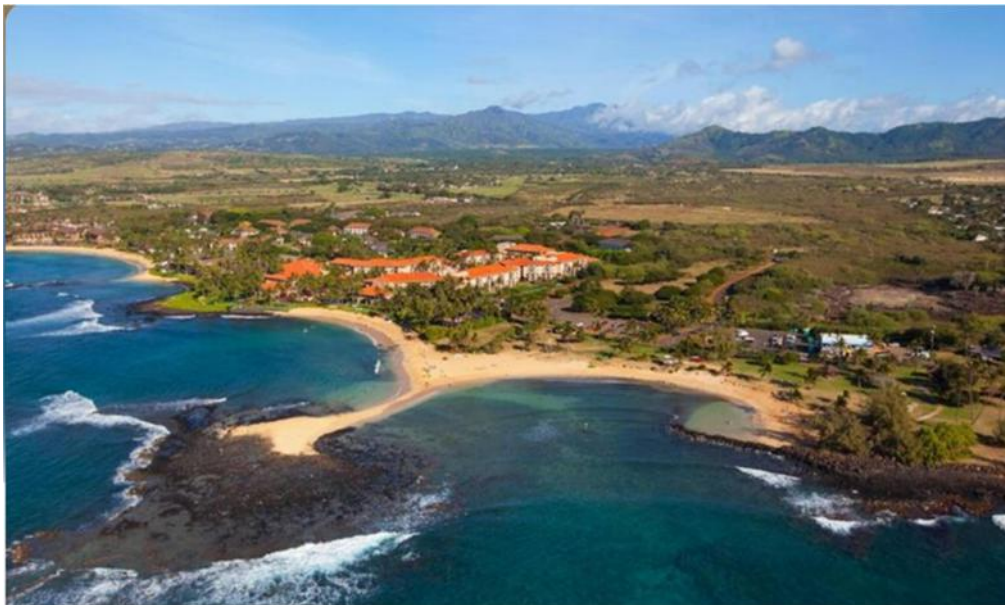
Ba bãi biển Poipu hình lưỡi liềm tạo thành ba hồ nước biển thiên nhiên (đảo Kauai)